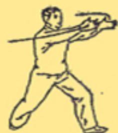
13. volo di colomba