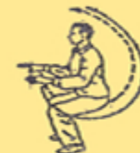
6. prendere concentr.