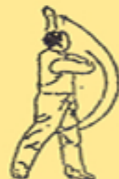
8. guardare la luna