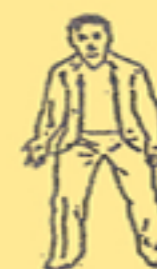
18. calmare il respiro