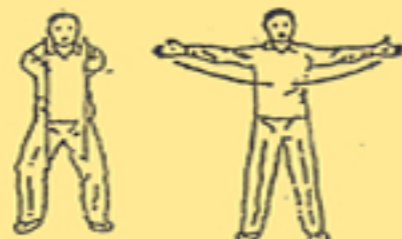
2. allargare mente-cuore