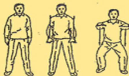
1. armonizzare il respiro