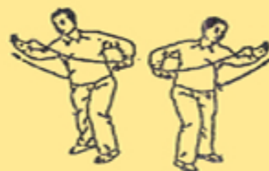
9. spingere col palmo