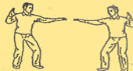
5. fendere le nuvole