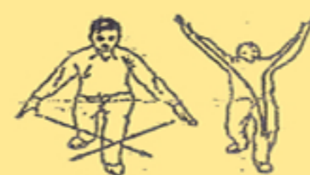
11. pescare e ringraziare