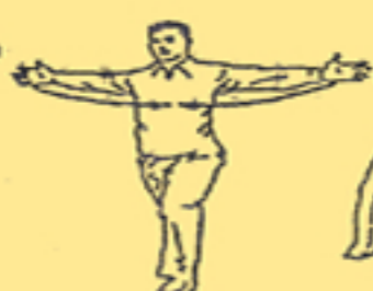
14. tirare pugni