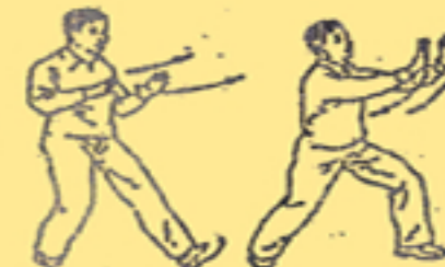
12. spargere le onde