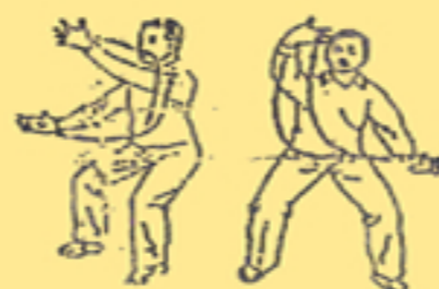
10. mani come nuvole