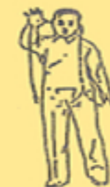
17. il bambino gioca con la palla