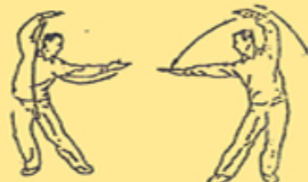
3. afferrare l'arcobaleno