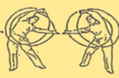
16. girare la ruota in cielo